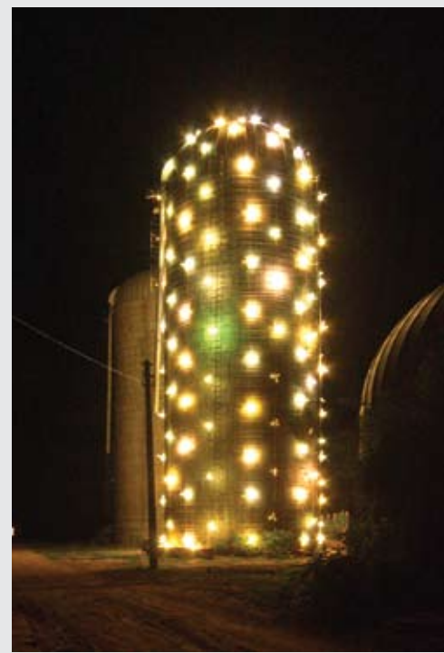
«Маяк Позитива», Силосная Башня, АрхФерма

Земля в «Душевном» преобразуется от сезона к сезону! Условия поселения изложены на сайте www.dushevnoe.ru