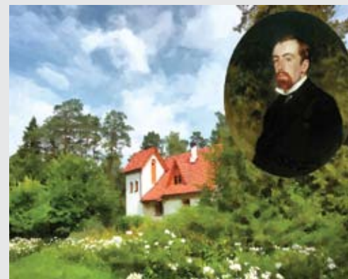
«Гнездо Художников» – «Аббатство», Построена по проекту Василия Поленова, 1904 г.