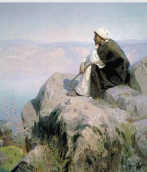
«Мечты», Василий Поленов, 1894 г. Серия «Из жизни Христа»