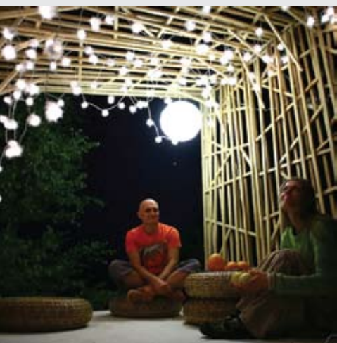
«Фермеры» с любовью обживают свою альма-матер» АрхФерма