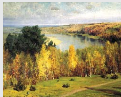
«Золотая осень», Василий Поленов, 1893 г.