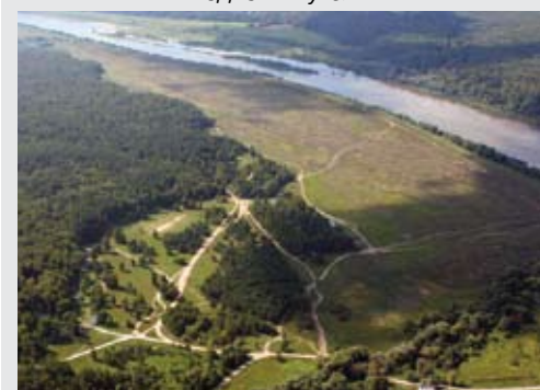
Поселок «У Оки»