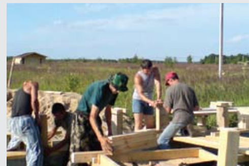
«Общее дело», Поселение «Душевное»