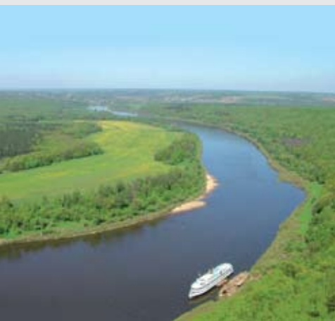
«На Оке», Ока в районе Тарусы