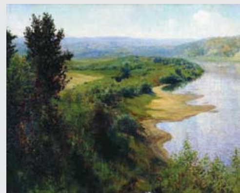
«Река», Василий Поленов, 1899 г.

В 2012 г., осенью, исполняется 120 лет усадьбе художника. Сегодня «Поленово» – государственный мемориальный историко-художественный и природный музей-заповедник: место, где память и традиции бережно хранятся, где дело мастера живет.