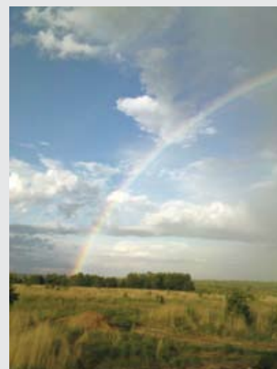
«Радуга Души», Поселение «Душевное», Заокский район