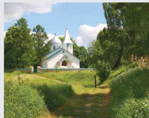
«Беховская церковь», Построена по проекту Василия Поленова, 1906 г.